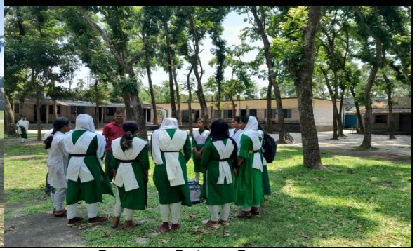
টেপুরডাঙ্গা উচ্চ বিদ্যালয় (২৩/১০/২০২৪) শব্দভান্ডার খেলা পলাশবাড়ি পরশমণি উচ্চ বিদ্যালয় (০৬/০৬/২০২৪)