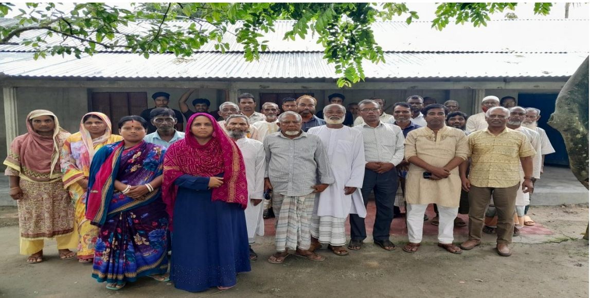
পাড়া ভিত্তিক শিক্ষা উন্নয়ন কমিটি গঠনের প্রস্তুতি সভা (১৩/০৬/২০২৪, টেপুরডাঙ্গা উচ্চ বিদ্যালয়, নীলফামারী)

টেপুরডাঙ্গা উচ্চ বিদ্যালয় ব্যবস্থাপনা কমিটি ও শিক্ষকের সহায়তায় স্কুল ক্যাচমেন্ট এলাকার সকল পাড়া থেকে বিভিন্ন ক্যাটাগরীর (প্রধান শিক্ষক, অবসরপ্রাপ্ত শিক্ষক, নির্বাচিত ব্যক্তি, খেলোয়ার, সঙ্গীত শিল্পী, স্বাস্থ্য কর্মী, বিশ্ববিদ্যালয় পড়ুয়া, শিক্ষা অনুরাগী) ১৭ সদস্য নিয়ে একটি স্কুলে শিক্ষা উন্নয়ন কমিটি গঠিত হয়। ফলে শিক্ষা অঙ্গনে সমাজের সম্পৃক্ততা বাড়বে এবং শিখন-শিক্ষন পরিবেশ, ব্যবস্থাপনা ও সহপাঠ্যক্রমিক কার্যাবলীর মধ্য দিয়ে মানসম্মত শিক্ষা নিশ্চিত হবে।