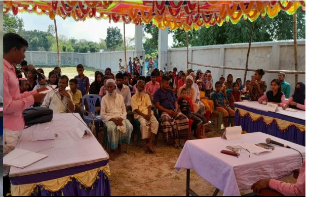
কুকড়াডাঙ্গা উচ্চ বিদ্যালয় (০২/১১/২০২৩)