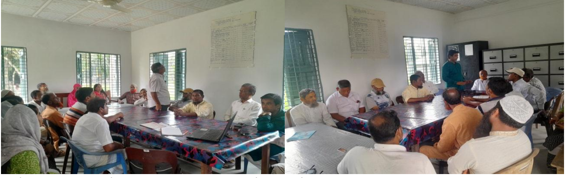
বার্ষিক পরিকল্পনা পর্যালোচনা ও পাড়াভিত্তিক কর্মসূচি নির্ধারণ (২৯/১১/২০২৪, টেপুরডাঙ্গা উচ্চ বিদ্যালয়)