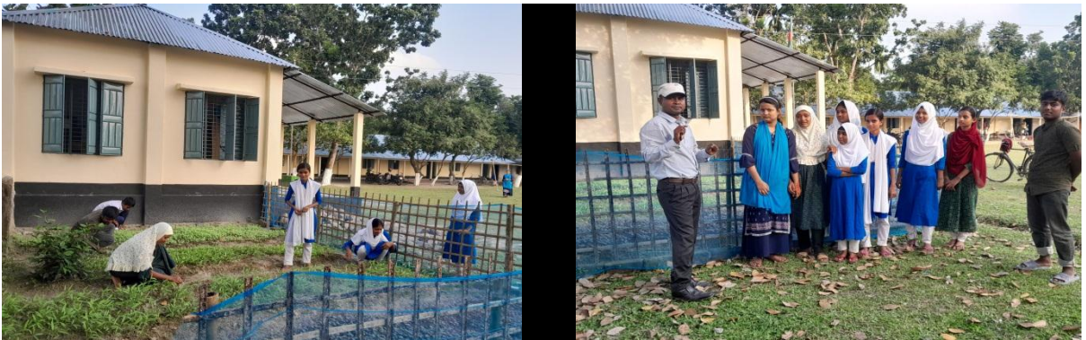
সবজি পরিচর্যা ও সবজি চাষের প্রয়োজনীয়তা আলোচনা (০৫/১১/২০২৪, টেপুরডাঙ্গা উচ্চ বিদ্যালয়)

স্কুল পর্যায়ে কৃষি শিক্ষক কর্তৃক সবজি চাষ প্রদর্শনীর মাধ্যমে বসতবাড়িতে সবজি চাষের জন্য উদ্বুদ্ধ করা হয় এবং এর প্রয়োজনীয়তা তুলে ধরা হয়। ফলে শিক্ষার্থীদের বাস্তবভিত্তিক জ্ঞান অর্জনের পাশাপাশি একদিকে পুষ্টিকর খাবারের চাহিদা মিটেছে অপরদিকে অর্থনৈতিক স্বনির্ভরতার উপায় খুঁজে পাচ্ছে।