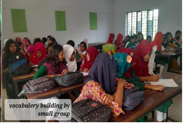
দুবাছুরী বালিকা উচ্চ বিদ্যালয় (ইংলিশ ক্লাব ওরিয়েন্টেশন ও বই বিতরণ)