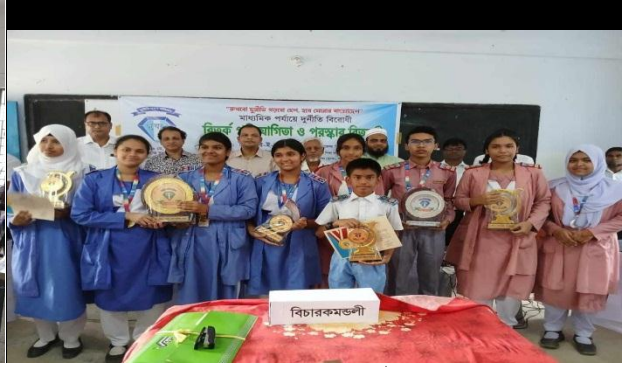
সানফ্লাওয়ার স্কুল এ্যান্ড কলেজ, সৈয়দপুর