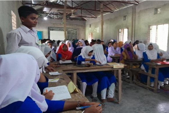
টেপুরডাঙ্গা উচ্চ বিদ্যালয় (২৬/১১/২০২৪)