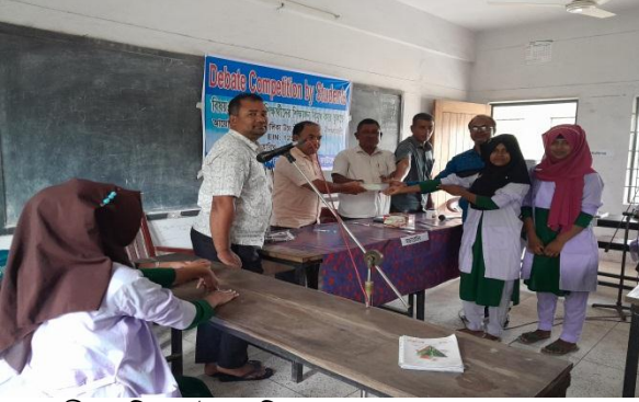
দুবাছুরী বালিকা উচ্চ বিদ্যালয় (০১/০৬/২০২৪)

শিক্ষার্থীদের তথ্য, জ্ঞান, বাচনভঙ্গি ও নেতৃত্ব বিকাশের পাশাপাশি আনন্দ ঘন পরিবেশ তৈরী করা এবং শিশুদের পড়াশুনার প্রতি উৎসাহ বাড়ানোর জন্য নীলফামারী জেলায় ৫টি স্কুলে বিতর্ক ক্লাব গঠন করা হয়। ষষ্ঠ থেকে নবম শ্রেণির মোট ৩২ জন শিক্ষার্থীদের নিয়ে প্রতি স্কুলে ১ দিনের ওরিয়েন্টেশন সম্পন্ন হয়। শিক্ষক তাদেরকে নির্দিষ্ট বিষয়ের উপর নির্দেশনা দেন এবং শ্রেণিভিত্তিক, স্কুলভিত্তিক ও আন্তঃস্কুলভিত্তিক বিতর্ক প্রতিযোগিতা অনুষ্ঠিত হয়। ফলশ্রুতিতে প্রত্যন্ত স্কুলগুলোতেও বিতর্কিকের সংখ্যা এবং চাহিদা ক্রমান্বয়ে বাড়ছে।